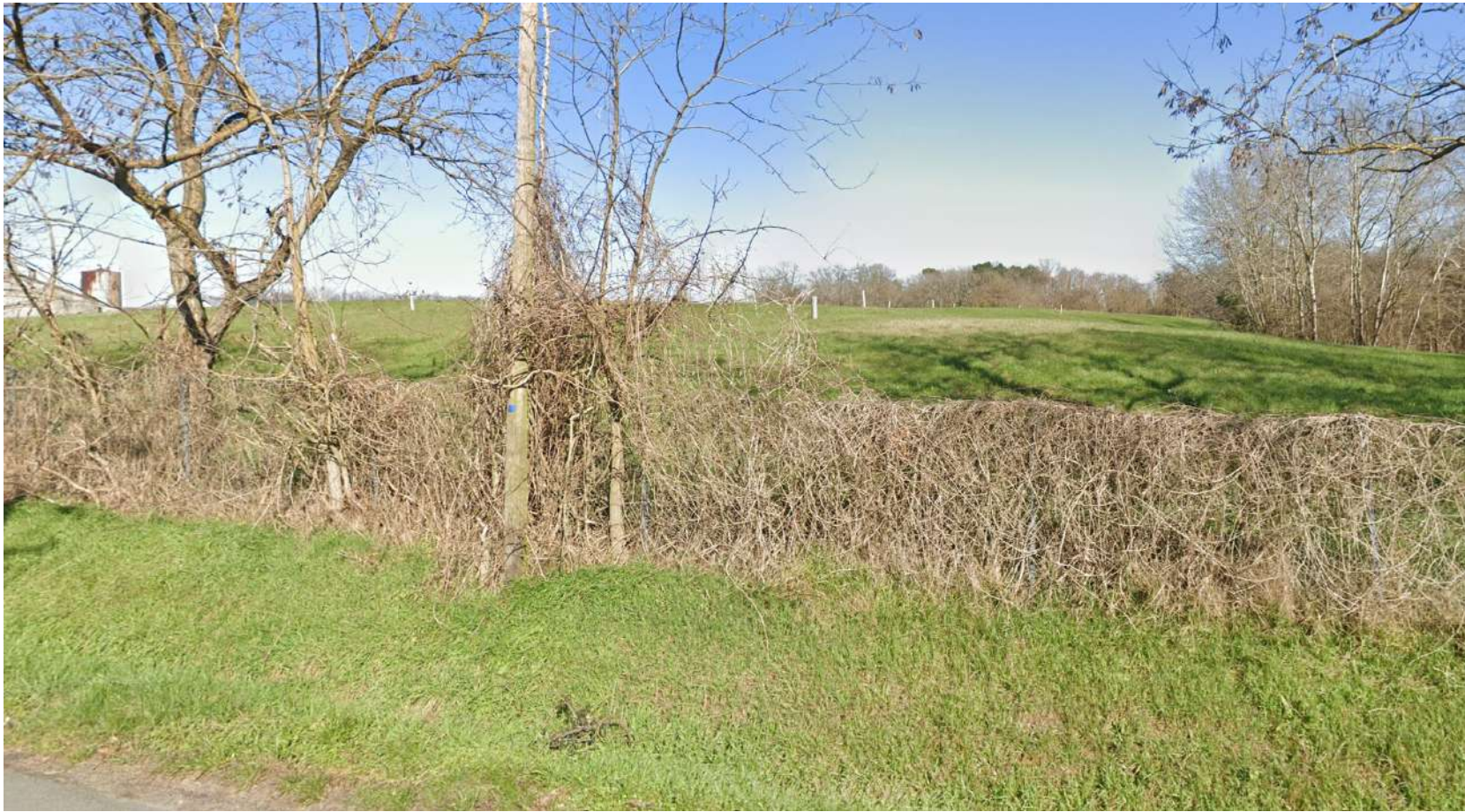
PDV 1 - Localisation du projet dans son environnement proche