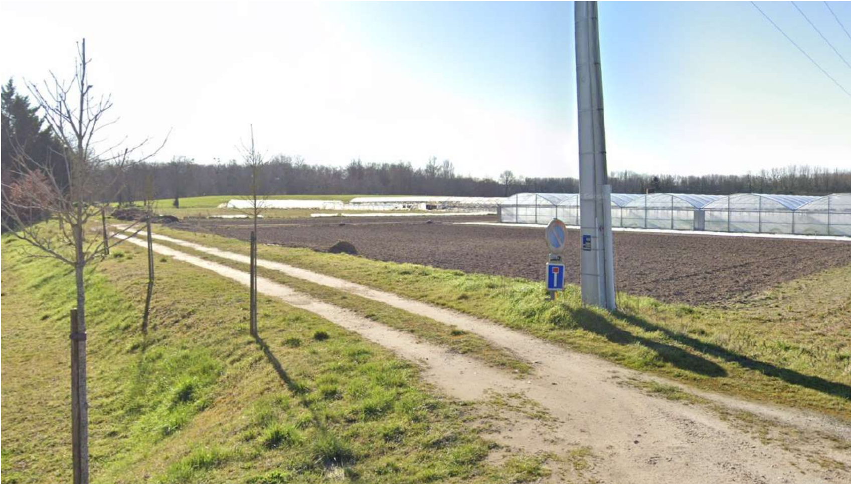
PDV 2 - Localisation du projet dans son environnement lointain